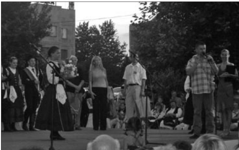
Na otvoritvi festivala