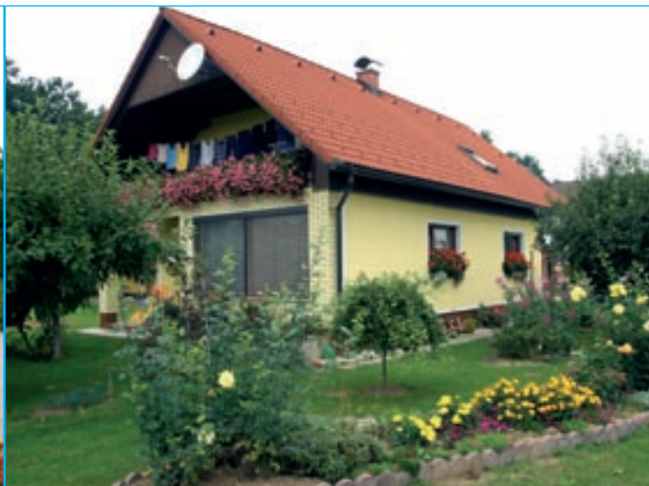
Franc in Viktorija Toplak, Strelci 5/a