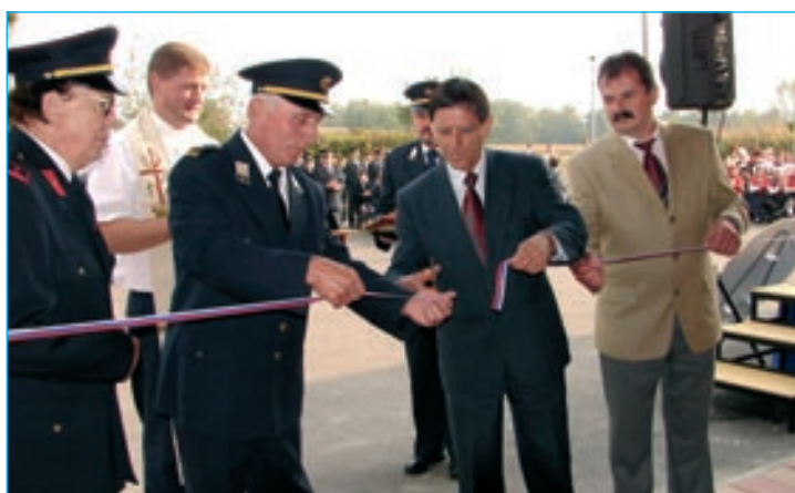
Slavnostni prerez vrvice