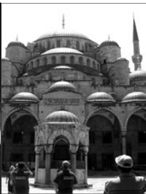
Carigrajska (istanbulska) džamija