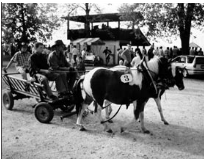
Na tekmovanju v Šentjerneju