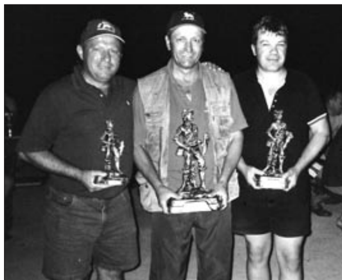
Tekmovanje v ligi ŠRD Markovci 2006