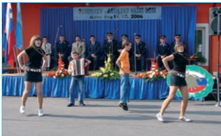
»Nagošejnski Atomik Harmonik«