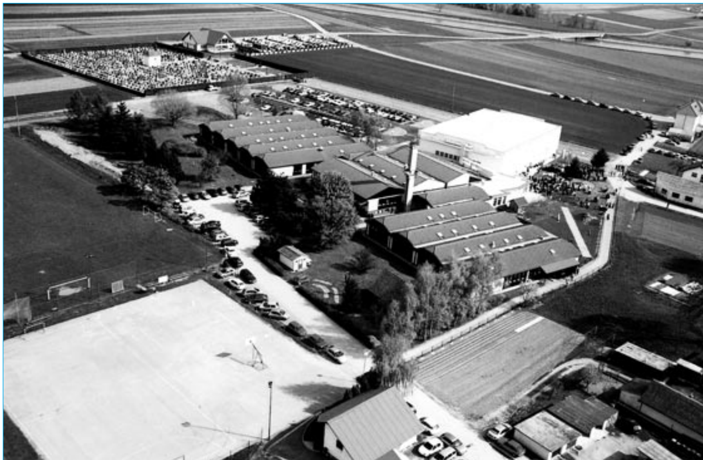
V letošnjem letu sta bili namenu predani dve investiciji: nova večnamenska dvorana in pokopališka vežica.