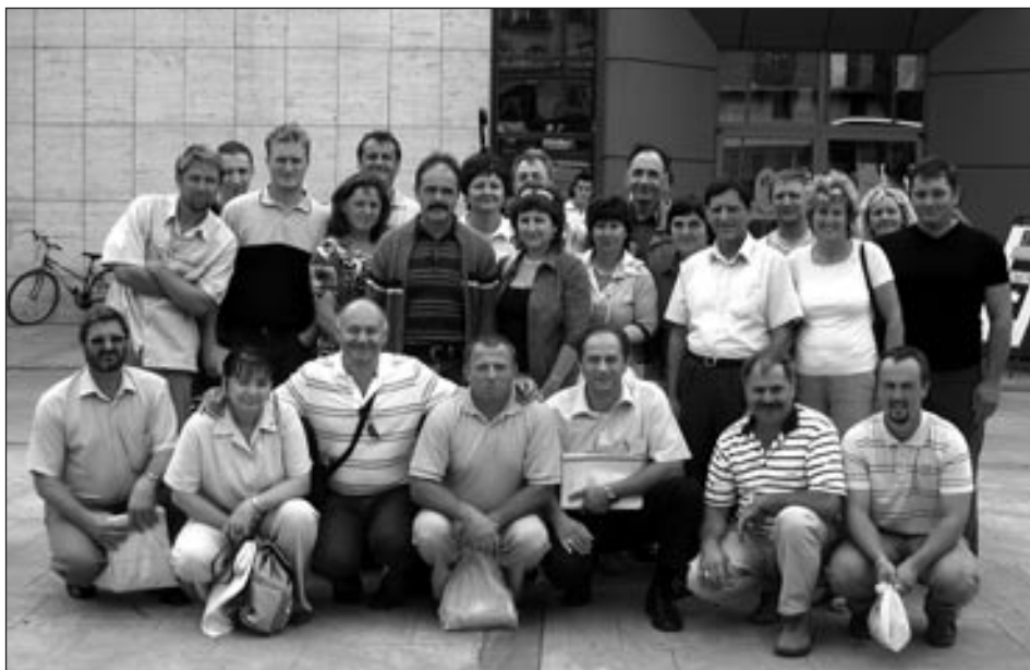
Udeleženci ekskurzije na MOS v Celju.

Ob 15. uri smo se markovski obrtniki dobili na parkirišču in se napotili proti hotelu Rogla v Zrečah. Ob odlični hrani in dobrem domačem pivu smo si še vzeli čas za kratke pomenke, se nasmejali pre-