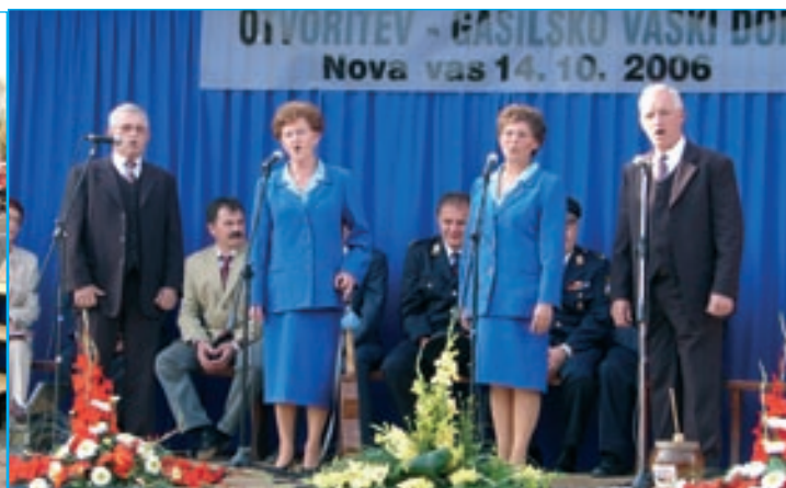
Ljudski pevci in godci iz Bukovcev