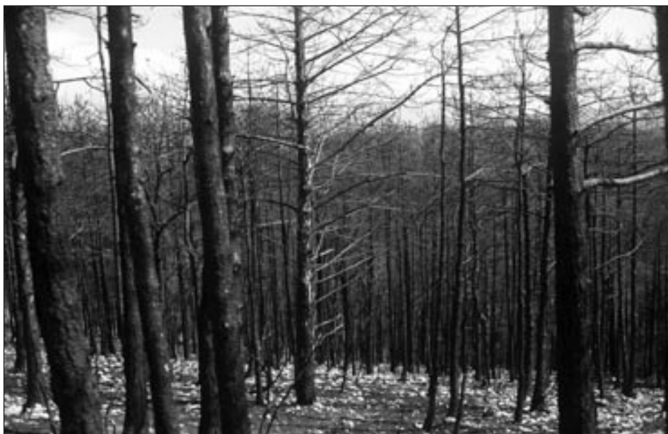
Požar na Komnu (Šumka) je uničil 790 ha kraškega gozda. Zoglenela stebela in golo kamenje dajeta zelo neprijeten občutek.

Letošnji oktober – mesec požarne varnosti – je posvečen uporabi gasilnih aparatov v gospodinjstvu, v avtomobilih, skratka tam, kjer je z njim mogoče v prvi fazi preprečiti najhujše. Gasilci bodo na predavanja povabili vaščane in jih podučili, kako ravnati z gasilnimi aparati, kako, kdaj in kje se ti servisirajo, možno pa bo tudi