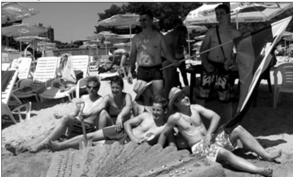
Tekmovanje v peščenih skulpturah