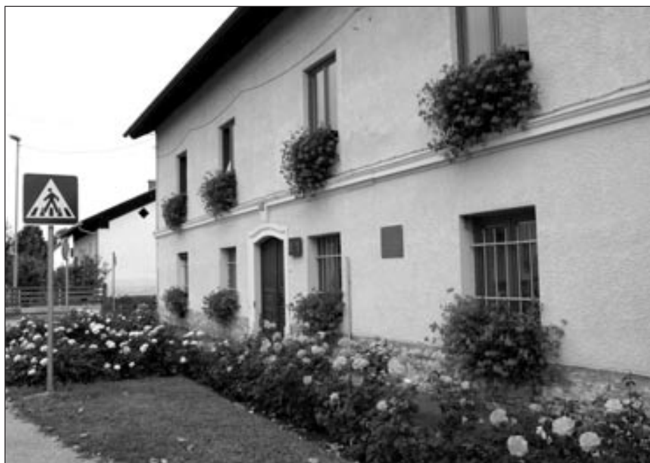
Najlepše urejen vaški objekt: Župnišče Markovci