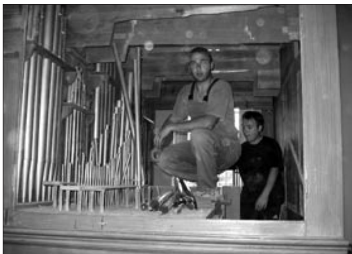
Začelo se je z odstranjevanjem piščali.