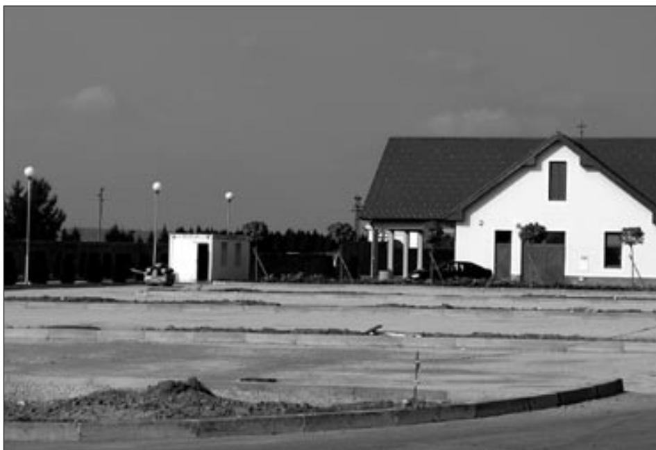
Pri pokopališču urejajo dodatne asfaltirane parkirne prostore.

V začetku meseca oktobra bomo nadaljevali drugo fazo ureditve centra Markovci, ki bo zajemala naslednjo fazo del: izgradnjo kanalizacije od župnišča (križišča z Zabovci) proti gasilskemu domu Markovci in od večnamenske dvorane Markovci proti domu upokoencev do križišča pri cerkvi v dolžini cca. 400 m. V tem delu trase je že izgrajena javna razsvetljava in izvedeno kabliranje zračnih elektro vodov, zato se izvede samo rekonstrukcija obstoječega vodovoda v dolžini 400 m. Z izvajalcem del, Cestno podjetje Ptuj, d. d., smo že sklenili pogodbo za izvedbo kanalizacije v vrednosti 42.862.918,44 SIT z DDV. Rekonstrukcijo vodovodnega omrežja pa bo izvajalo Komunalno podjetje Ptuj, d. d., vzporedno z izvedbo kanalizacije. Financiranje rekonstrukcije vodovodnega omrežja je razdeljeno med izvajalca in investitorja,