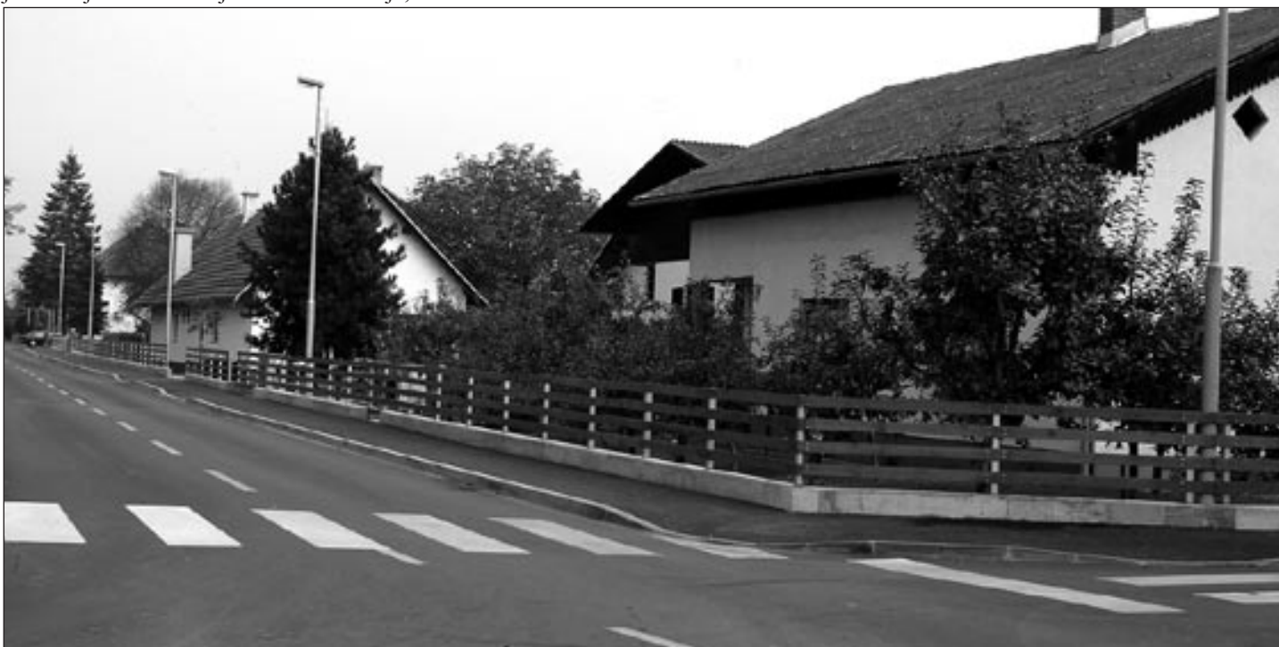
Pogled na urejen center vasi Markovci