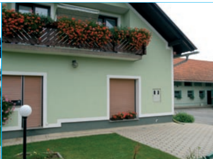
Naj kmetija 2006: Kmetija Cimerman, Stojnci 84