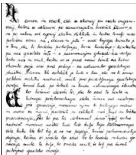
Uvodni list iz ohranjene kronike društva

Na slovesnosti ob 60-letnici društva je predsednik dejal: »Ko se oziramo nazaj, ugotavljamo, da se je v teh letih skupaj z vaščani mnogo postorilo na operativnem in preventivnem področju. Prav v tesnem sodelovanju se kažejo uspehi, brez finančne pomoči vaščanov ne bi bilo toliko postorjenega.«