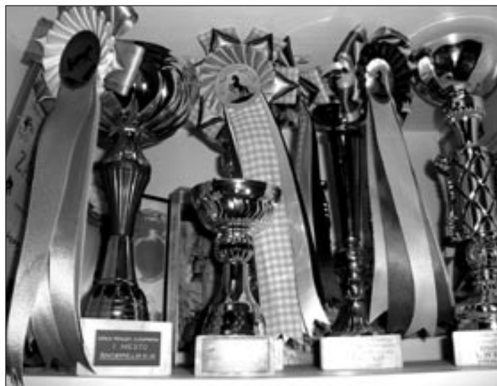
Zbirka pokalov, ki so jih Kekčevi fantje osvojili na konjeniških tekmovanjih.