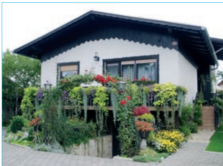
Družina Bromše, Nova vas 11/a