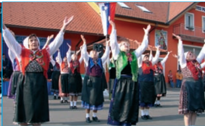
Šturmovske grabljice občine Markovci