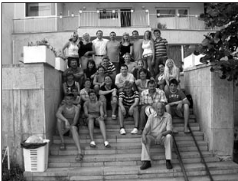
Pred hotelom v Primorskem

Folklorno društvo Markovci prireja v petek, 20. 10. 2006, folklorni večer s pričetkom ob 20. uri. Nastopajo: FS Markovci, FS Dolena, FS Beltinci, Ljudske pevke FD Markovci in FS Cirkovce.