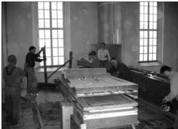
Na koncu je ostal le še meh in nekaj drobnih delov.