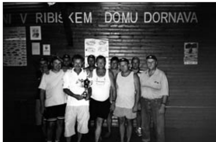
Medobčinsko tekmovanje v Dornavi