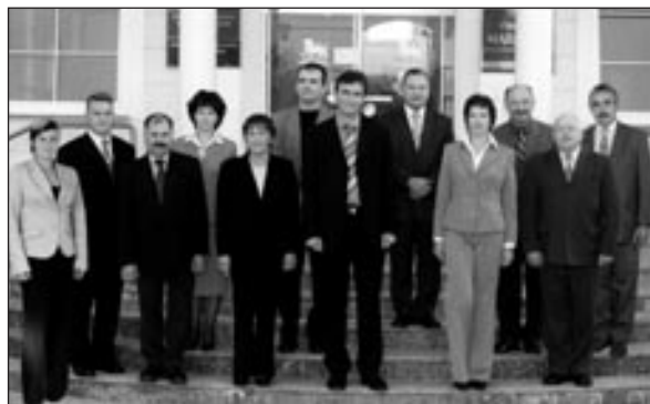
Kandidati/-ke OO SDS za občinski svet občine Markovci 2006