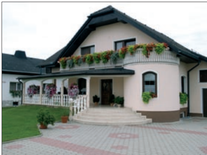
Družina Bezjak, Borovci 5/c